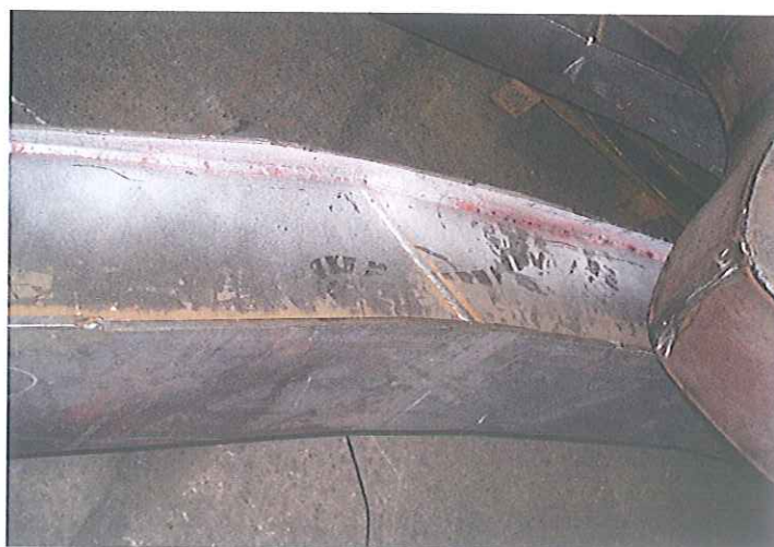
Fotografías de algunas uniones inspeccionadas