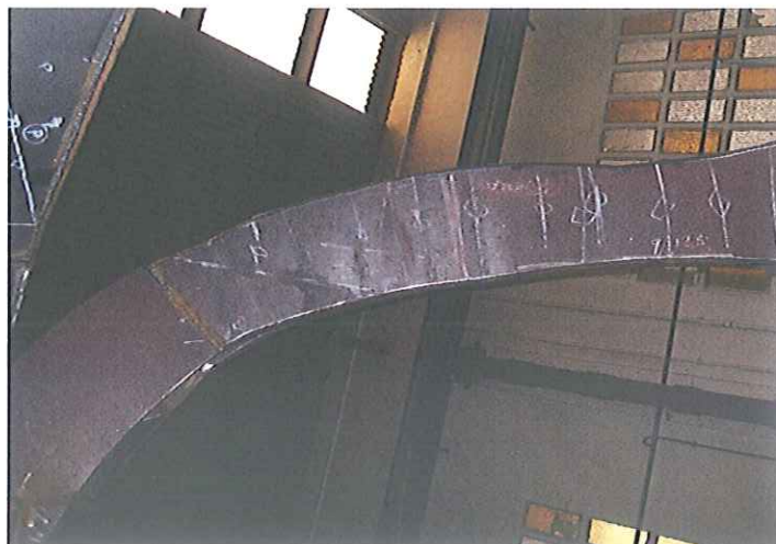
Fotografías de algunas uniones inspeccionadas